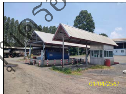
ภาพที่ 1-1 ลักษณะกิจกรรมบริเวณพื้นที่โครงการ