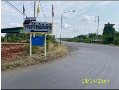
รูปที่ 1-2 เส้นทางคมนาคมเข้าสู่พื้นที่โครงการ